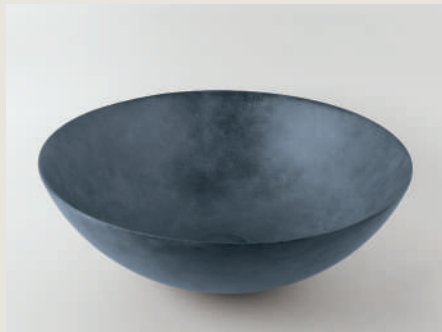
LAVABO MATTER BLUE 225777 /ZP 1150 40 X 15 CM