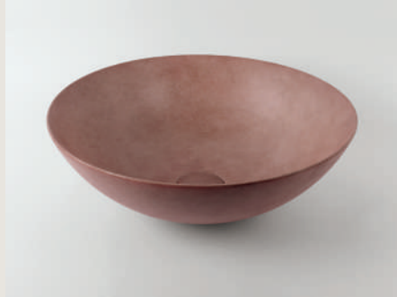
LAVABO MATTER RED 225778 /ZP 1150 40 X 15 CM