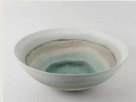
LAVABO CANVAS GREEN 225782 /ZP 1150 40 X 15 CM