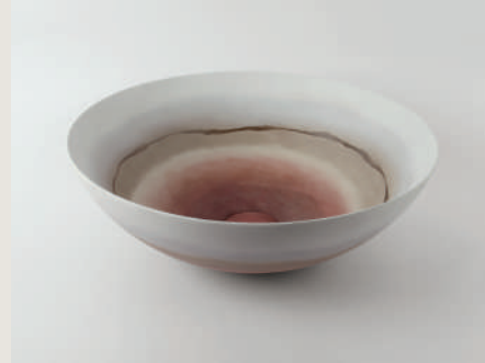
LAVABO CANVAS RED 225781 /ZP 1150 40 X 15 CM