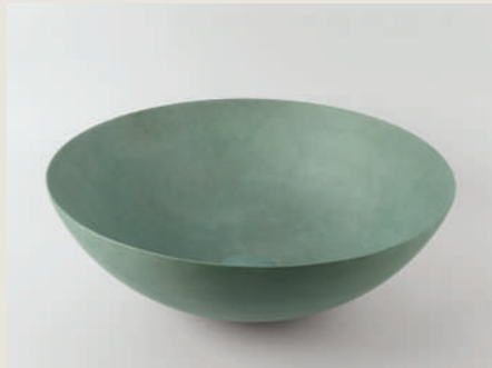
LAVABO MATTER GREEN 225779 /ZP 1150 40 X 15 CM