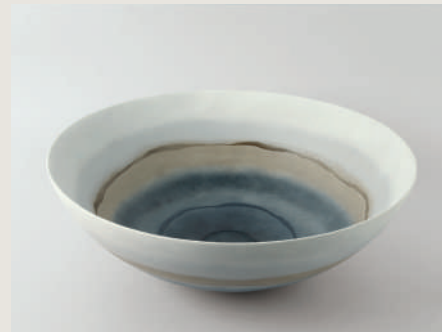
LAVABO CANVAS BLUE 225780 /ZP 1150 40 X 15 CM